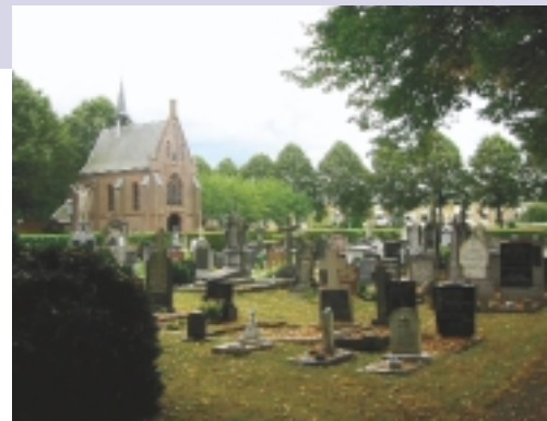
Kapellen werden gebouwd voor het houden van diensten op begraafplaatsen. Hoewel hun functie in de afgelopen decennia niet zelden overbodig is geworden, vormen ze desalniettemin onmisbare elementen op de begraafplaats. Rooms-katholieke Begraafplaats in Sneek

Gaan we ervan uit dat ontwerpers rekening hielden met een termijn van vijftig tot honderd jaar voor een volgroeid bomenbestand, dan zijn er tegenwoordig nogal wat negentiende-